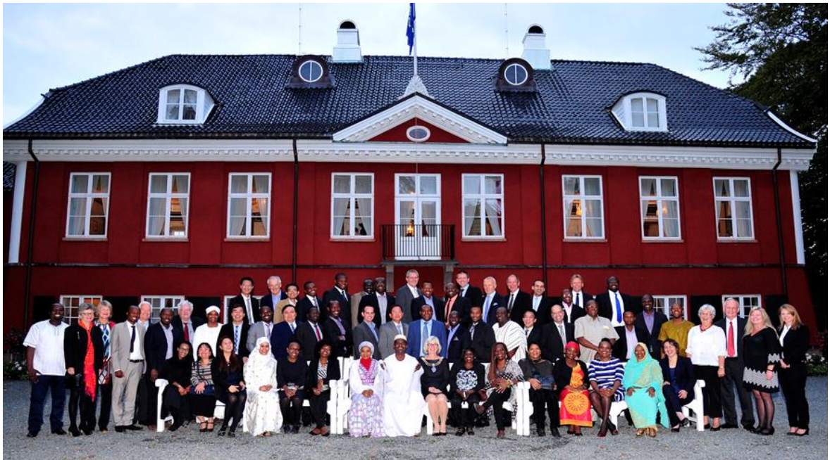
47 offentlig ansatte fra 18 land på 8 ukers campus i Stavanger under utdanning i petroleumsforvaltning, høsten 2014