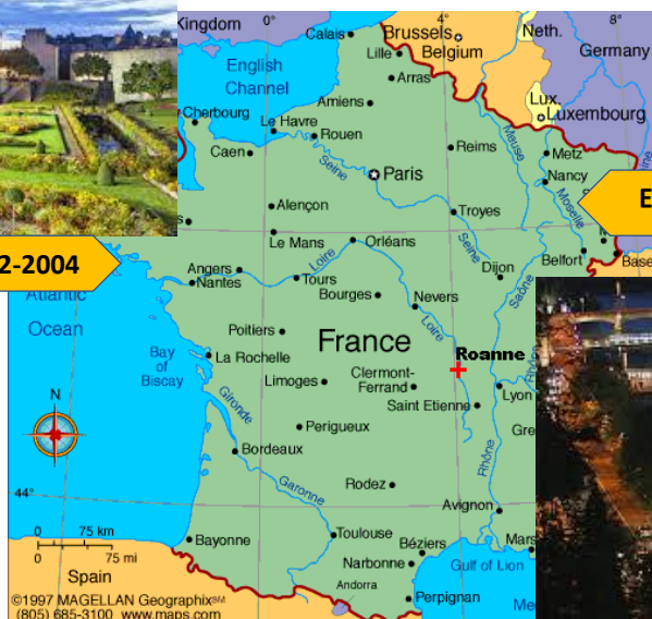
Epinal, Lorraine, 2001-2002