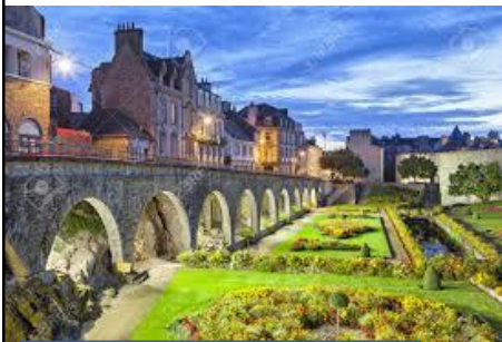
Vannes, Bretagne, 2002-2004

Rotary Oslo Vest, Schafteflokken, 1. februar 2017