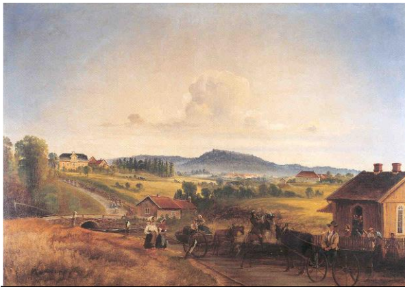
Majorstuen mot Vestre Aker, 1844. Oslo