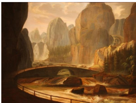
Peder Balke (1804-1887) Carl Johans Klev, 1831

Samtidens malere dro til Tyskland. Balke seilte nordover, nådde Vardø og Vadsø. Resten av livet skildret han opplevelsene på reisen v vi .