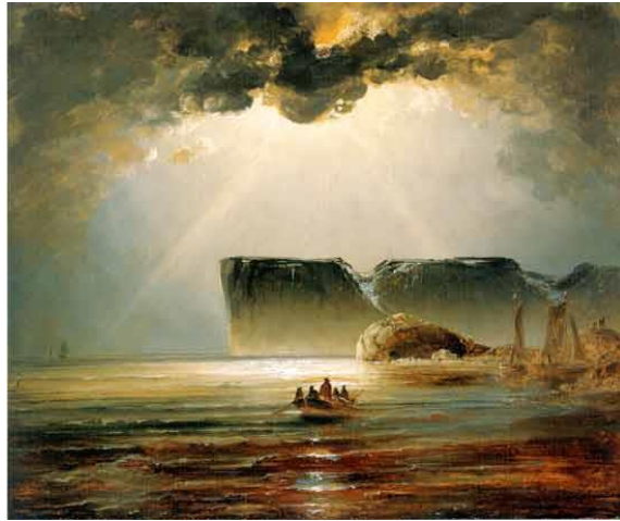
Fra Nordkapp ca 1840